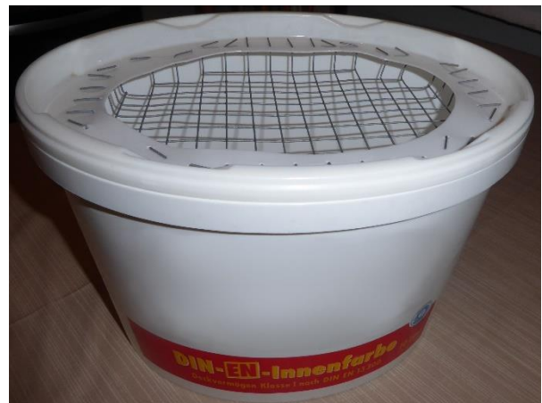
Abb. 4: Farbeimer mit Gitterdeckel