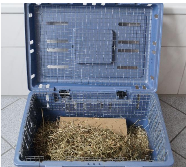
Abb. 2: mit Gitter gesicherte Kunststoffbox