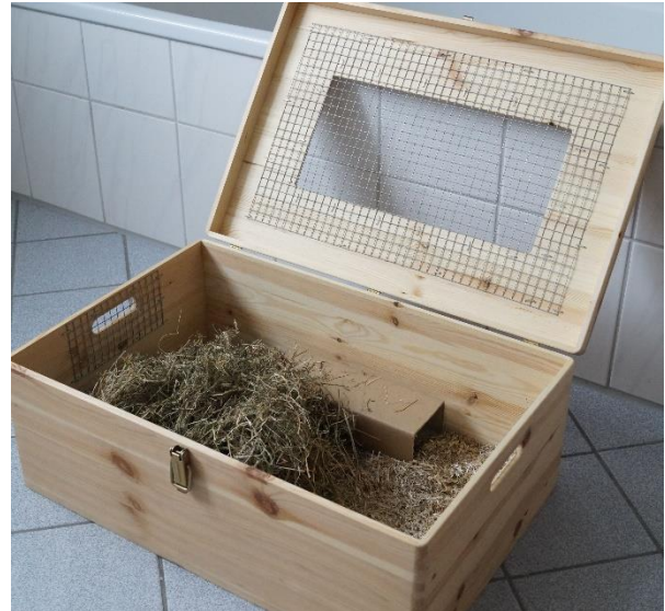
Abb. 3: mit Gitter gesicherte Holzbox